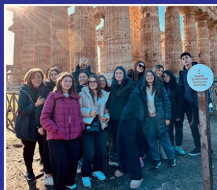
Viaggio classi terze Paestum