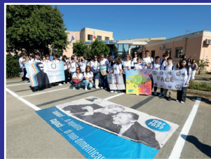
Marcia della Pace 6 Maggio 2024