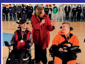
Sport senza barriere