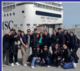
Viaggio classi quinte Crociera Mediterraneo Occidentale