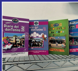
Progetto Redazione "Diario del Don Tonino" realizzato dalla nostra redazione e donato a tutti gli studenti