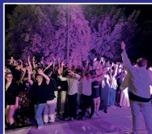
Liceissimo 2024 III Edizione