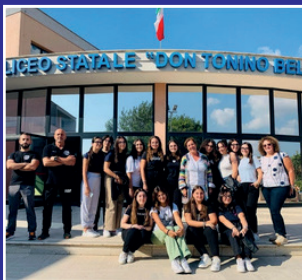
"Cambio Rotta" Corso di difesa personale Coop. IRIS