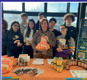
"Cancro io ti boccio" AIRC