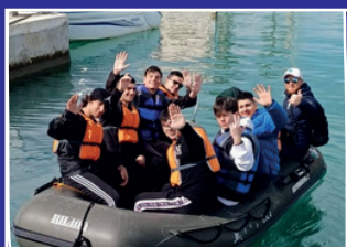
Campus Velico di Policoro