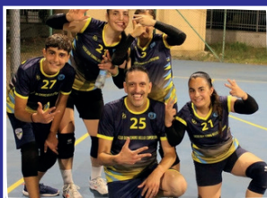
Torneo di Volley "Dal tramonto all'alba" - Parco Mandela