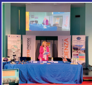
Festa della Scienza