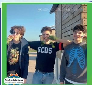
Gamification- parco di Padula Cupa

I PCTO consentono allo studente di acquisire o potenziare, in stretto raccordo con i risultati di apprendimento, le competenze tipiche dell'indirizzo di studi prescelto e le competenze trasversali, per un consapevole orientamento al mondo del lavoro e/o alla prosecuzione degli studi nella formazione superiore, anche non accademica. Le varie attività in PCTO sono condotte in contesti organizzativi e professionali, in aula, in laboratorio o in forme simulate, e in collaborazione con la Regione Puglia, la Provincia di Lecce, i Comuni, le Università del territorio, gli ITS, Associazioni, Cooperative ed altri Enti formatori.