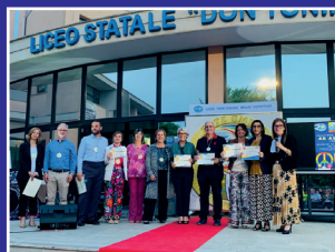
Evento Ad Astra II edizione 29 Maggio 2024