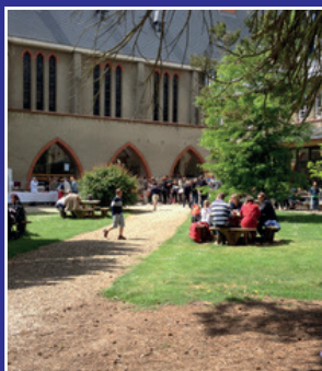
Institut Saint- Dominique Mortefontaine

Nell'a. s. 24-25 ci vedrà in Spagna, Francia e un terzo Paese della Comunità Europea.