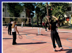
Progetto "Racchette in classe"