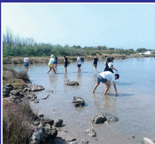
Percorso di Biologia marina Università del Salento