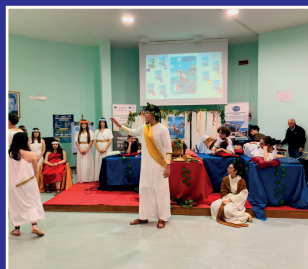
"La Notte del Liceo Classico" X Edizione