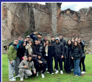
Viaggio classi quarte Villa Adriana, Tivoli