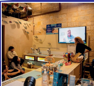
Settimana blu del Mare