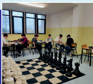
Progetto "Matto in tre mosse"

PEER TO PEER E CYBERUNITE BUSTERS presso Istituti Comprensivi.