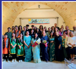
Scambio internazionale con la Him Academy Public School di Hamirpur (India)