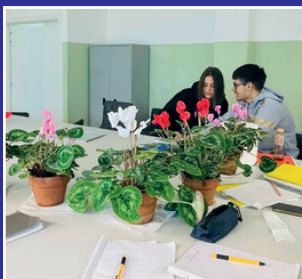
Laboratorio ecosostenibile EduGreen