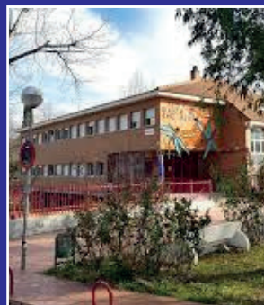
IES Francisco Giner De Los Rios Segovia