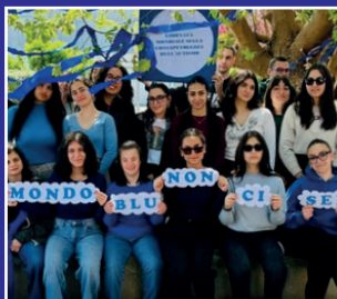
Giornata mondiale per la consapevolezza sull'autismo