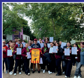
Stage 2 presso la Buckswood School di Hastings (Inghilterra)