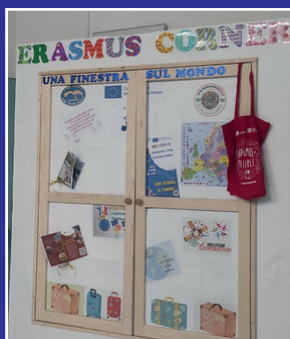
Erasmus is not one year in your life but your life in one year