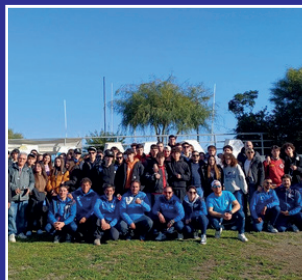
Campus Velico Policoro