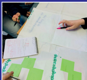
"Design Thinking"- ITS Turismo Allargato